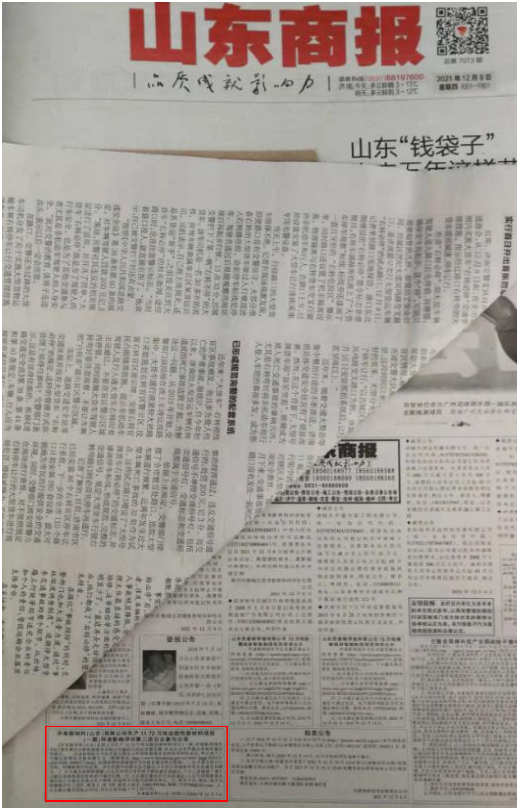
报纸第二次公示截图