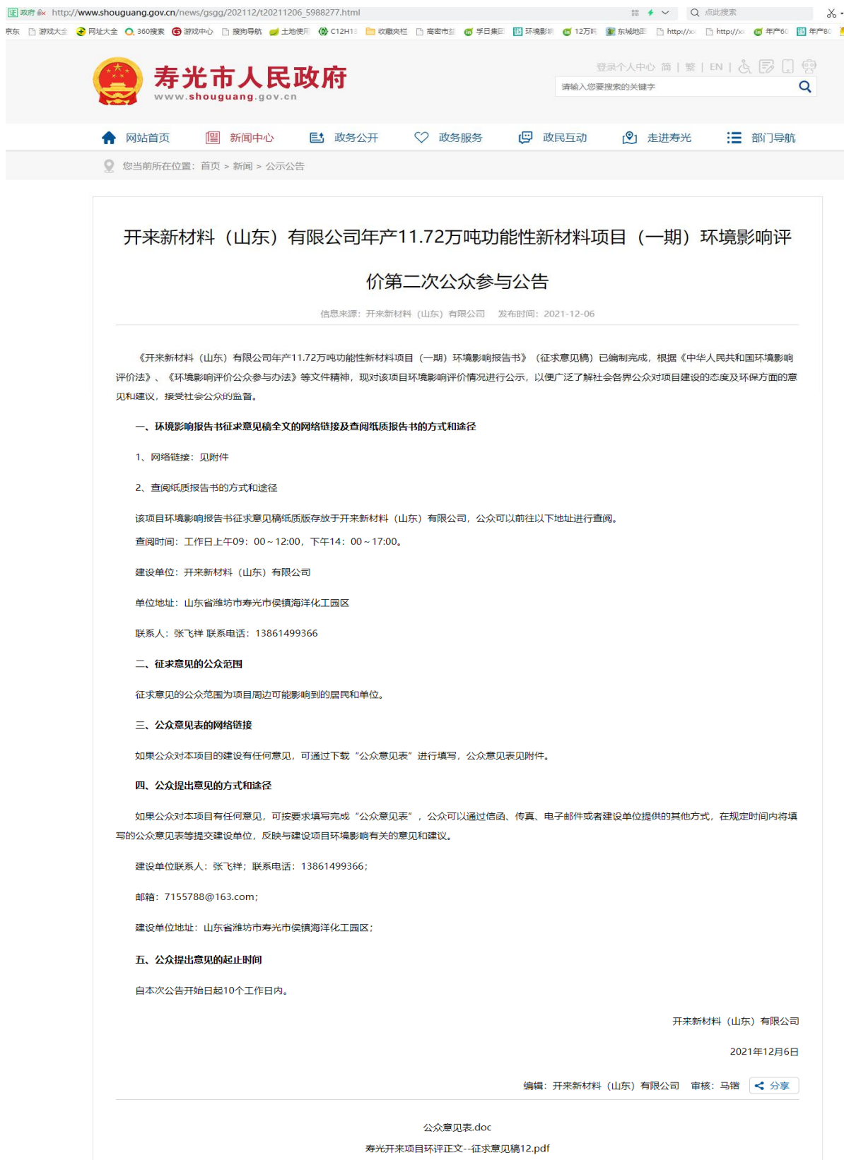
图 2-3 第二次网站公示截图