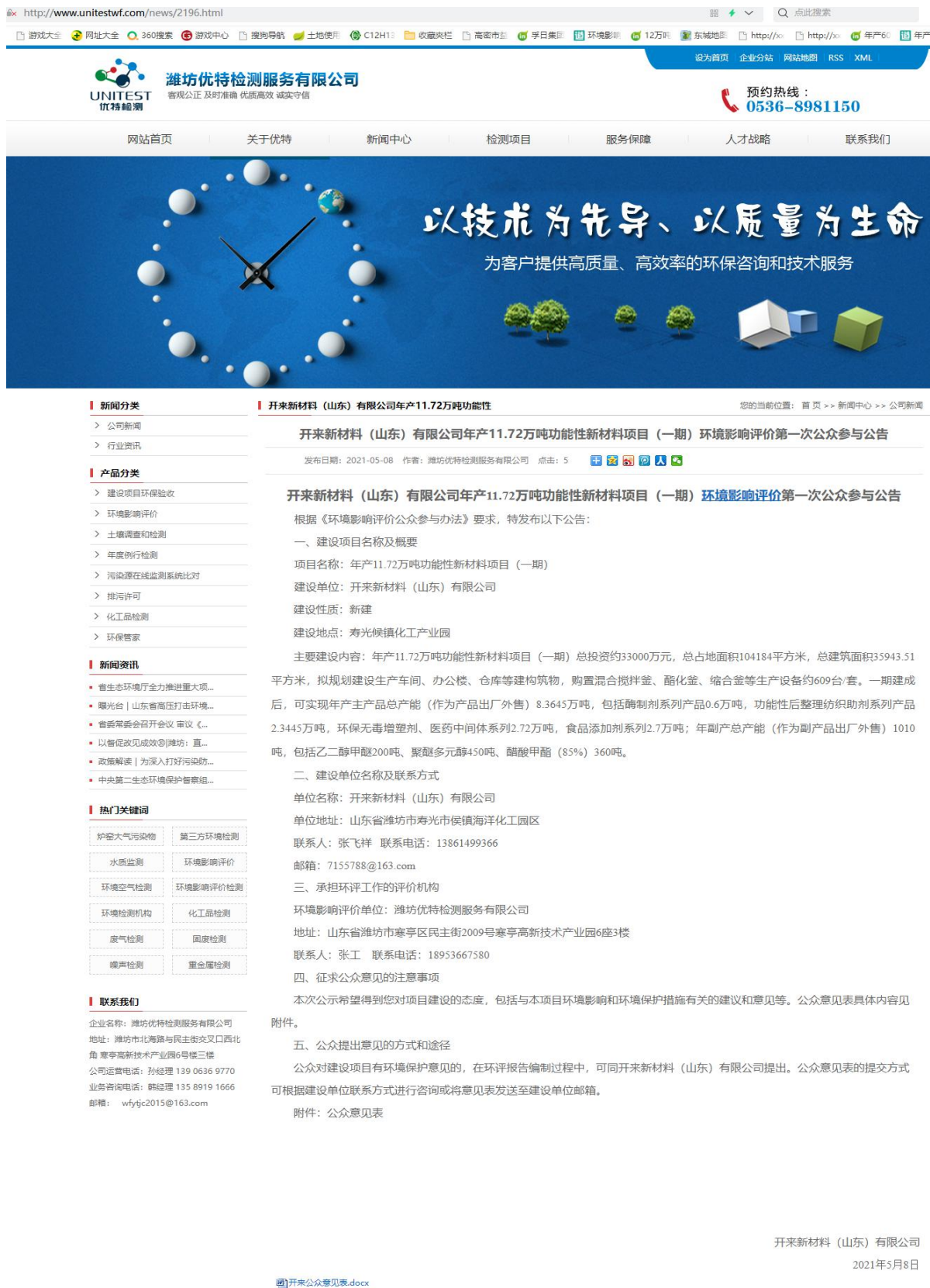
图 2-1 第一次公示网站截图