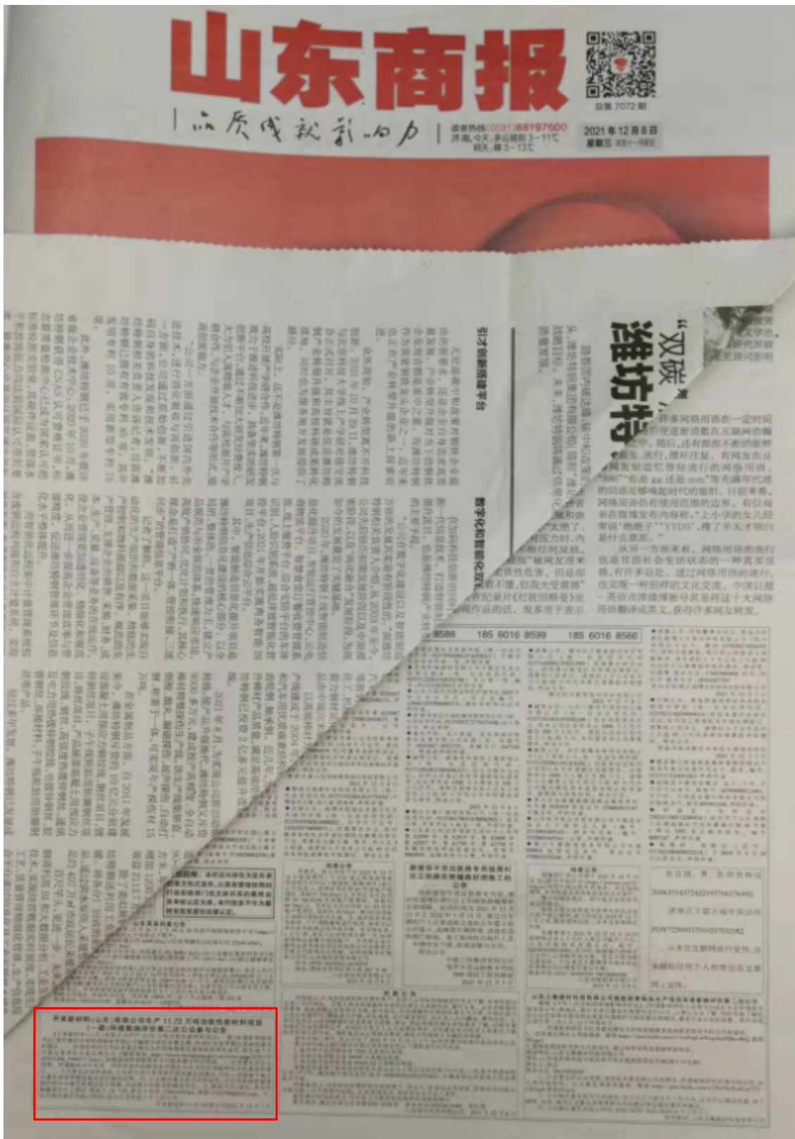
报纸第一次公示截图